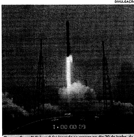
Foguete SpaceX Falcon 9 foi lançado ao espaço no dia 30 de junho, da Estação da Força Espacial de Cabo Canaveral, nos Estados Unidos